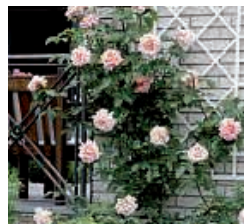
Je nach Kletterpflanzen-Typ werden unterschiedliche Kletterhilfen benötigt.